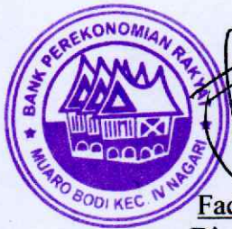
Fadhli, SE Direktur